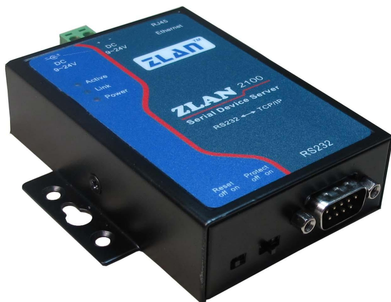
图 1 ZLAN2100 串口服务器

ZLAN2100 是一款高性价比的串口服务器，支持 DHCP、DNS，可轻松实现异地远程设备监控。支持虚拟串口，原有串口 PC 端软件无需修改。